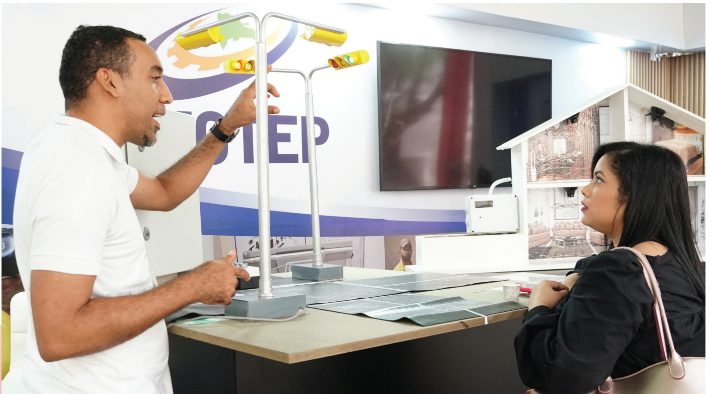
Joven emprendedor presenta proyecto a visitantes de su stand en la FIE 2023.