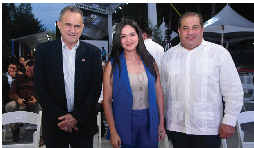
Representantes del sector industrial manufacturero durante el acto inaugural de la FIE 2023.