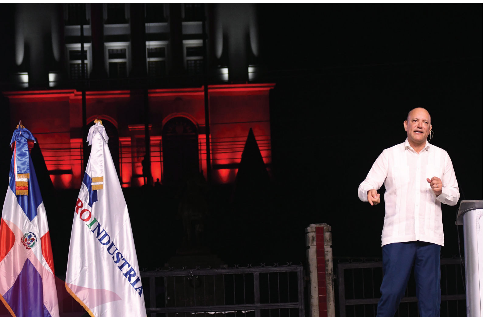
Director general de Proindustria ofrece discurso central durante acto de inauguración de la FIE 2023.

En ese sentido, aprovecho la ocasión para agradecer la presencia y el apoyo de los delegados que nos acompañan en este importante evento.