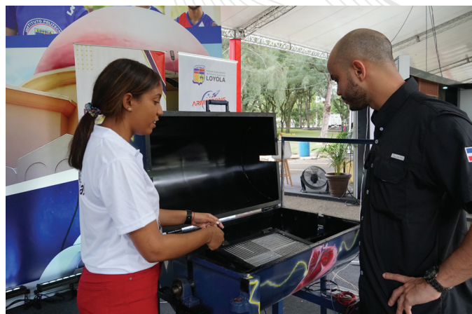
Emprendedores presentan sus proyectos a los visitantes de su stand en la FIE 2023.