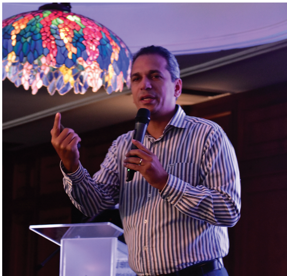
El rector del Instituto Tecnológico de Las Américas (ITLA) aborda las novedades de la tecnología aplicadas al sector industrial y al emprendedurismo.

ITLA hizo un desarrollo de un data verso de qué era el empleo con estudiantes y también con profesores y fue un éxito se conectaron más de 600 personas en una jornada de dos días y el metaverso lo hicimos un poco vago en el sentido de que aparte del diálogo tenía que usar el celular para que pudieran acceder, entraron 20 mil personas de manera concurrente entraron 10 mil concurrentes al mismo tiempo, 20 mil entraba una salía otro etc., entonces nosotros con ese tipo fijense cómo aportamos con un data verso a la sociedad 600 empleos de las mejores empresas como el Banco Popular, Banco de Reservas, Hard Rock Café, etc.