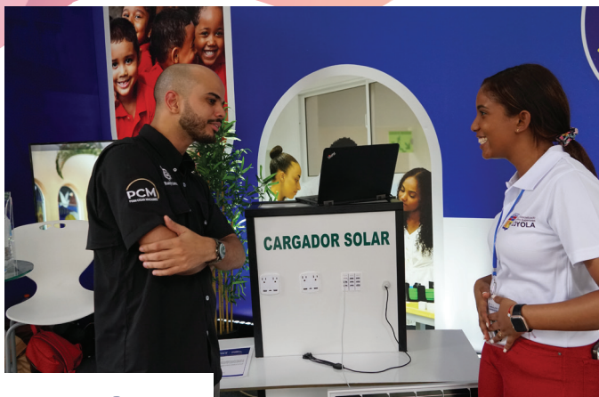
Emprendedores presentan sus proyectos a los visitantes de su stand en la FIE 2023.