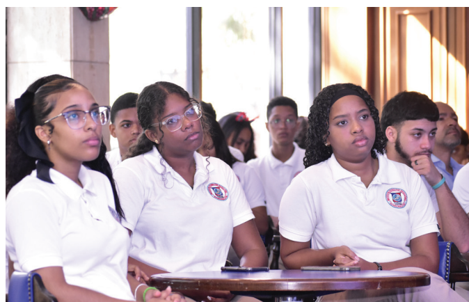
Estudiantes de nivel técnico secundario de Santiago escuchan ponencia.

Para mí es un gran honor compartir mis ideas con el presente y el futuro de República Dominicana, ustedes los jóvenes. Les hablaré de innovación, creatividad y emprendimiento, y sinceramente son tres temas fundamentales, entonces, la cuarta pata de la mesa tiene que ver con gestión de proyectos.