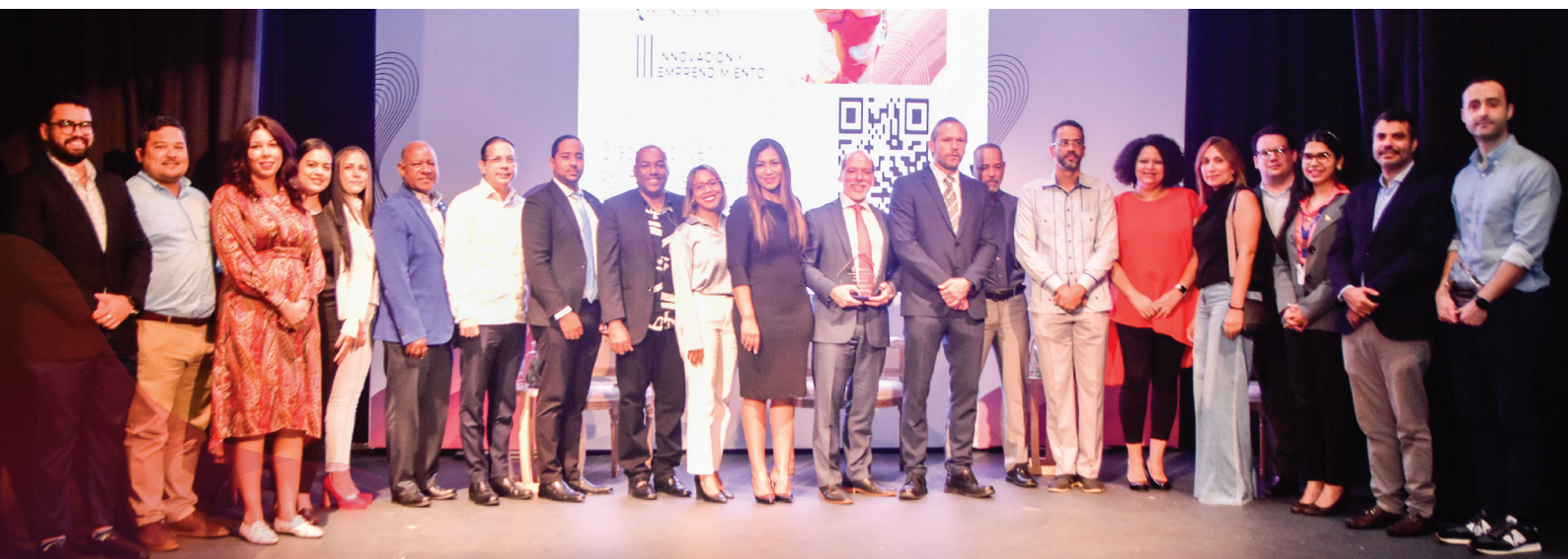
Participantes en el panel de Alianza Global para dar a conocer el proyecto de integración de Mipymes.

Cabe señalar que este proyecto es el resultado de la sinergia entre Alianza Global y otras nueve instituciones.